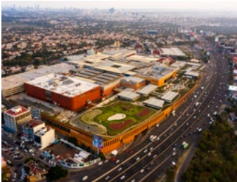
2020_PARQUE_PLAZA_SATELITE_PRINT_PHOTO_by_Jaime_Navarro_01.jpg Image Description: Plaza Satélite