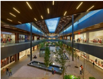
2013_ANTEA_PRINT_PHOTO_by_Paul_Rivera_04.jpg Image Description: Antea Lifestyle Center Image Credit: © SOMA, photo by Paul Rivera