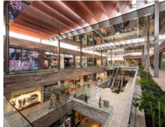
2018_AMPLIACIÓN_PLAZA_SATELITE_SMA_PRINT_PHOTO_by_Jaime_Navarro_05.jpg Image Description: Plaza Satélite