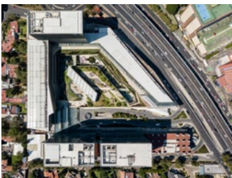
2018_ARTZ_SMA_PRINT_PHOTO_by_Rafael_Gamo_01.jpg Image Description: ARTZ Pedregal