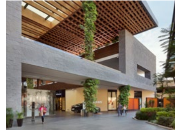
2010_LUXURY_HALL_PRINT_PHOTO_by_Paul_Rivera_01.jpg Image Description: Luxury Hall