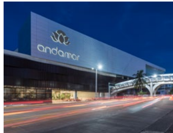
2014_ANDAMAR_SMA_PRINT_PHOTO_by_Jaime_Navarro_078.jpg Image Description: Andamar Lifestyle Center