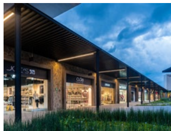
PREMIUM OUTLETS 5.09.19 (16).jpg Image Description: Premium Outlets Querétaro