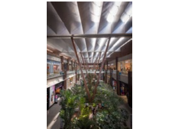
2014_ANDAMAR_SMA_PRINT_PHOTO_by_Jaime_Navarro_133.jpg Image Description: Andamar Lifestyle Center