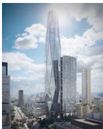
20200804_TRC_SMA_VC.jpg Image Description: Reforma Colón