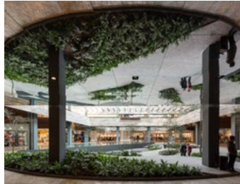
2018_AMPLIACIÓN_PLAZA_SATELITE_SMA_PRINT_PHOTO_by_Jaime_Navarro_01.jpg Image Description: Plaza Satélite