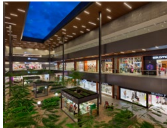
2013_ANTEA_PRINT_PHOTO_by_Paul_Rivera_05.jpg Image Description: Antea Lifestyle Center