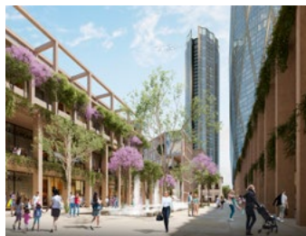
1 TRC CC BR.jpg Image Description: Reforma Colón